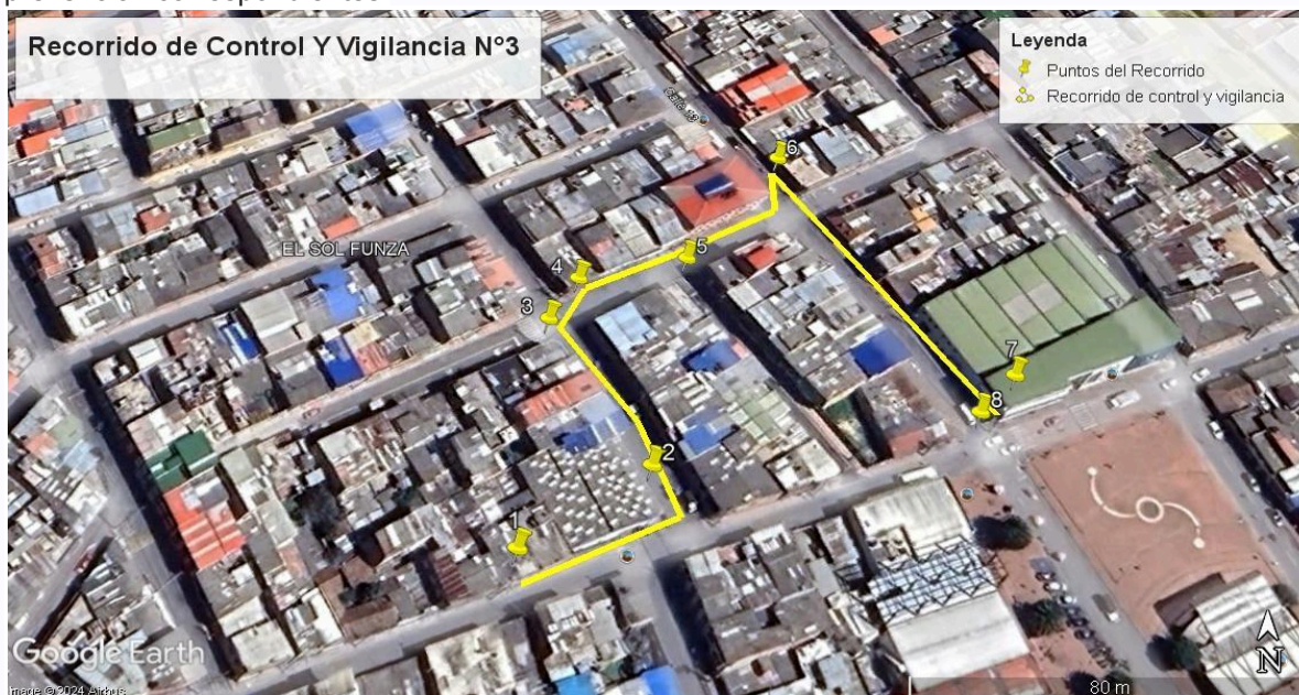
Ilustración 1. Recorrido de Control Y Vigilancia N°3

Se realizó recorrido de control y vigilancia en el cuadrante 3, barrio El Palmar el día 18 de abril del 2024, desde las coordenadas 4°43'3.198"N- 74°12'51.192" W hasta las coordenadas 4°43'4,272" N- 74°12'47.916 'W (ver ilustración 1. Ruta amarilla), con el fin de verificar las condiciones ambientales, identificar posibles afectaciones a los recursos naturales y realizar las acciones de prevención correspondientes.